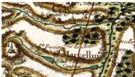
Carte de Cassini, vers 1751-1761